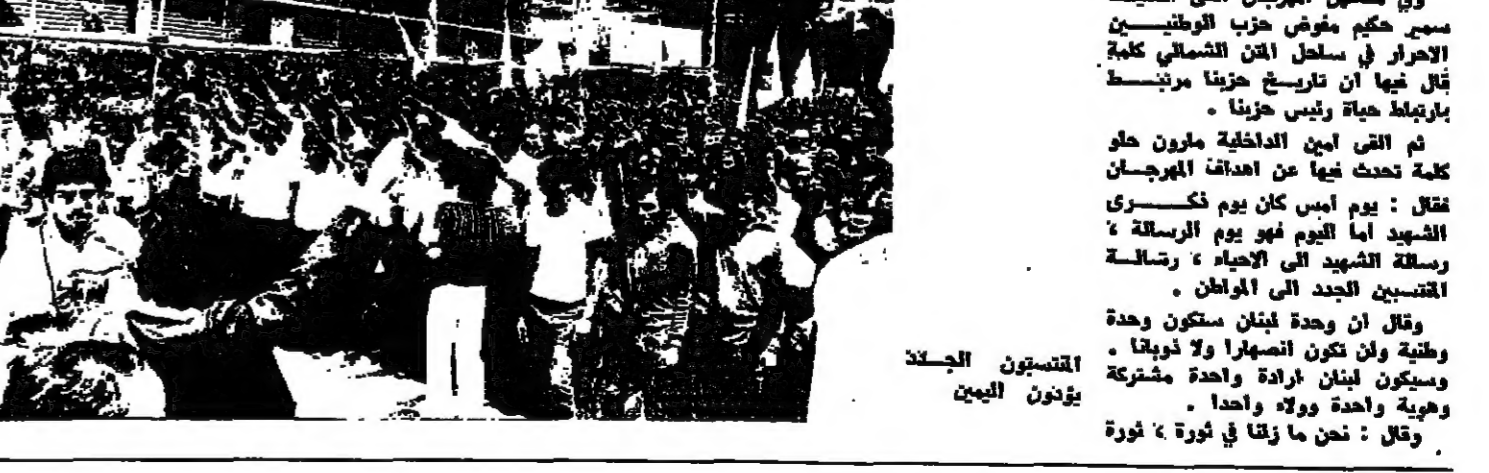
المتسبون الجلدة يؤنون للبنين

واضاف : كما اني اوجه كلمة شكر الى من اشرف على تنظيم هذا الاحتفال الرائع ، وان يكن احتفاء كبيرا فالتبث العاطفة على الانضباط ونظم الحواس على النظام وهذا ما يمكن ان يصل في مناسبات مثل هذه القاسية . وارجو ان تكون اجولة المستقبل ، واخص بالشكر كل من شاركنا في هذا الاحتفال من حضرات النواب ومن ممثلي السلطات المدنية والمسكرية والجناس المدنية ، كما لا يسعني الا ان اشكر الذين ساهموا معنا في هذا الاحتفال واعطوا البرهان القاطع على وحدة الصف ووحدة الكلمة ووحدة النضال .